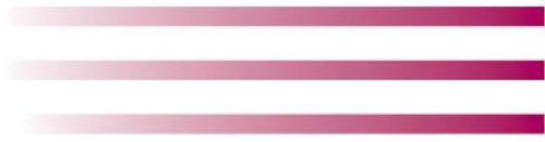
Table des aînés de la MRC des Pays-d'en-Haut