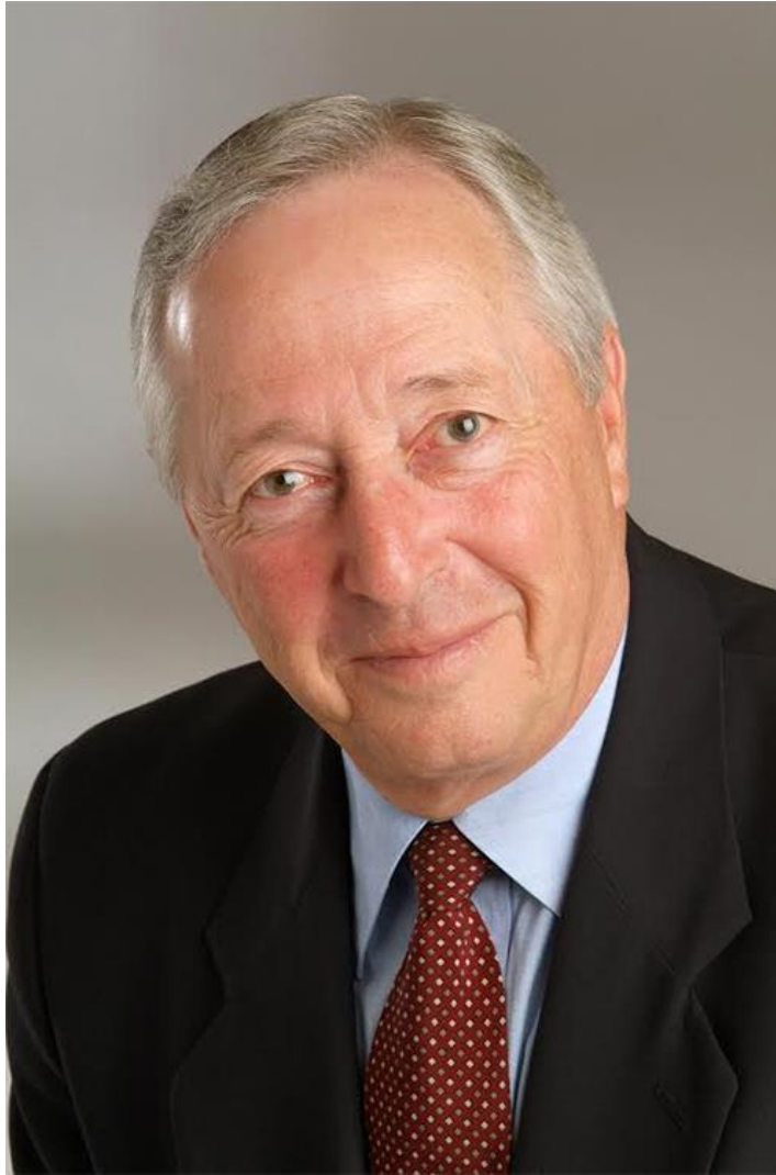
Michel Doyon, lieutenant-gouverneur du Québec

Encore cette année, l'honorable J. Michel Doyon, lieutenant-gouverneur du Québec, souhaite décerner la Médaille du Lieutenant-gouverneur pour les aînés et sollicite la coopération des organismes du milieu, d'une part, en soumettant des candidatures et, d'autre part, en diffusant l'information sur le programme.