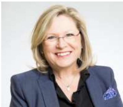
Francine Charbonneau, ministre responsable des Aînés et de la Lutte contre l'intimidation 4 juin 2018

Citation « Les milieux de vie doivent être des lieux où les aînés peuvent vivre sereinement et où leurs droits sont respectés. Le groupe d'intervention verra à déployer les efforts requis pour permettre la mise en place et le maintien de conditions de vie optimales favorisant le mieux-être des aînés du Québec. »